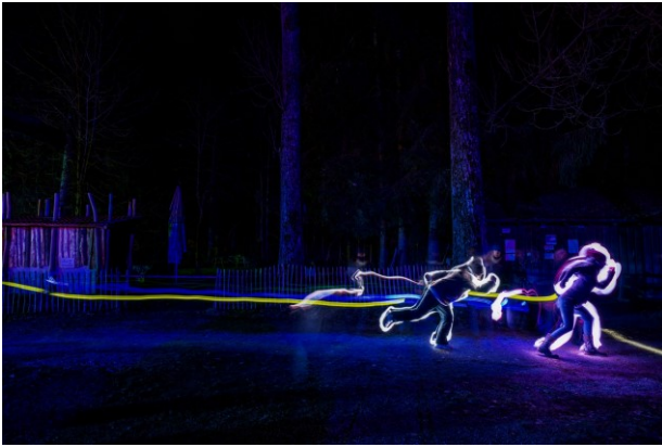
Titel: Heiner im „Ring of Fire“

Heiner hatte eine tolle Idee mit dem Light-Painting. Leider veröffentlichte das WM-er Tagblatt kein Foto dazu. Ihr aber sollt schon sehen, wie toll das aussieht. Offensichtlich macht es den Kids auch Spaß.