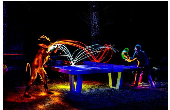
Titel: Abschließend noch eine Runde Tischtennis.

Der Landesverband Bayern veranstaltet noch bis Ende März „Die große Foto-Challenge“. Die jetzt laufende 3. Runde dreht sich um das Thema „Jugend und Umwelt – Umweltschutz für Deine Kinder“. www.naturfreunde-bayern.de/grosse-fotochallenge-bayern-braucht-naturfreunde